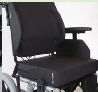
アームサポート・レッグサポートが外れ、バリアの少ない移乗を実現