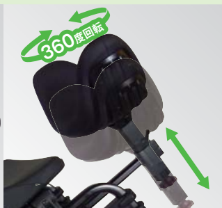
前後・上下に調節可能なヘッドサポート