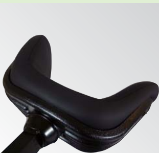
頭部を保持するクッション性の高いヘッドサポート