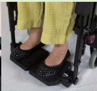
足底の高い安定性を実現するフットサポート